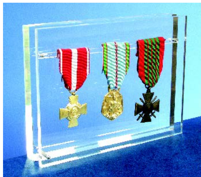
Porte-décorations 200 x 150 mm 3 à 4 rubans